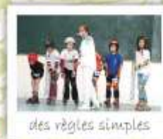
des règles simples